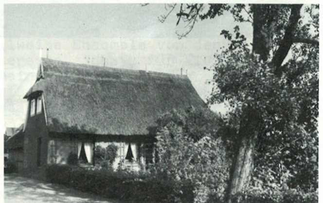
Kate am Eichholzfelder Deich