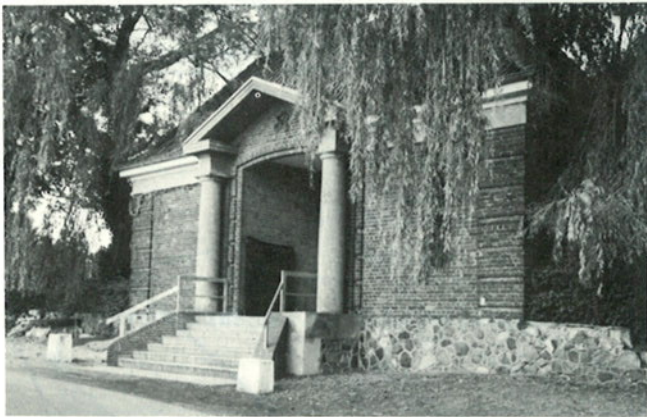
Portal zum Kirchhof