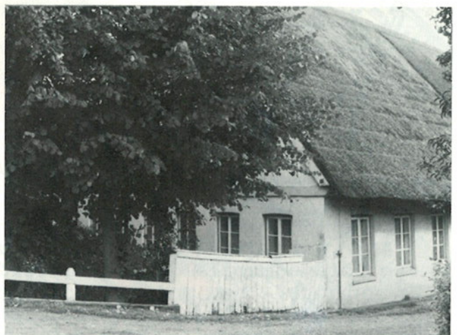
am Ochsenwerder Norderdeich