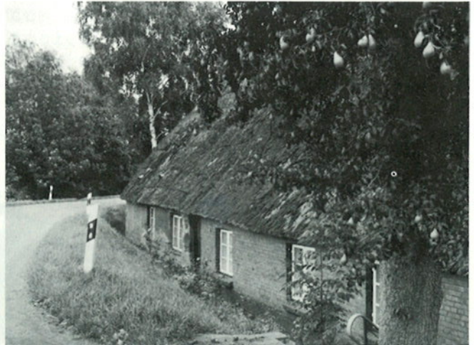
am Ochsenwerder Norderdeich