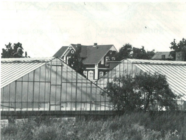
typische Ansicht: Treibhäuser und Gründerzeitgebäude